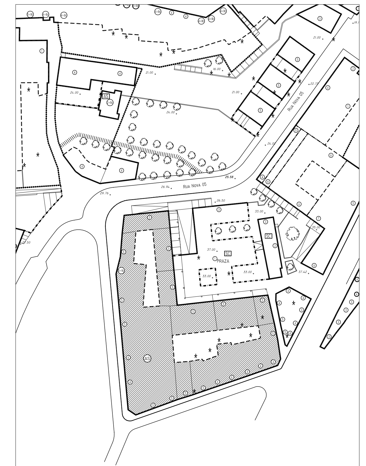
24620-B ESQUEMA DISTRIBUTIVO DE ALZADOS.